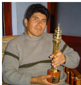
GM JULIO GRANDA PERU